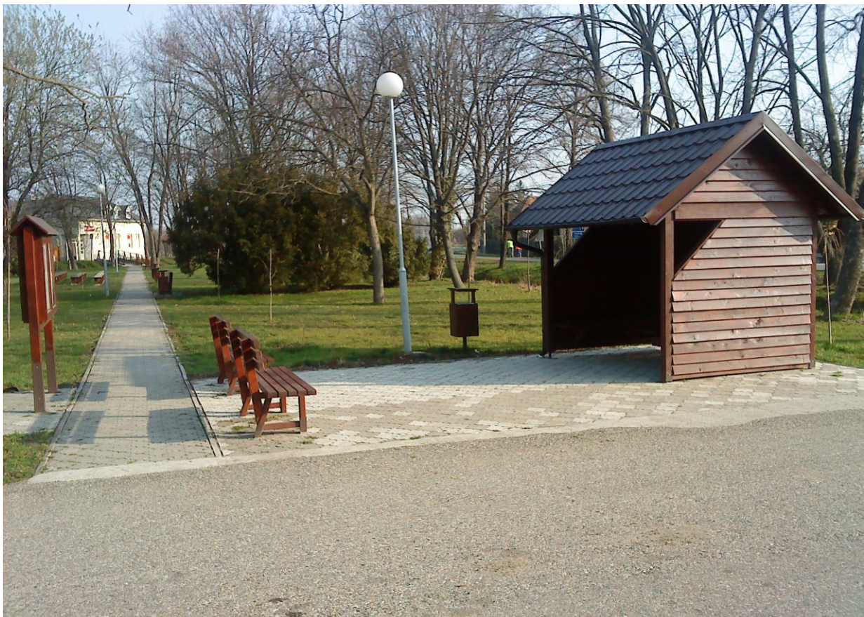
Rekonštruované centrum obce

Z dôvodu prasknutia vodovodného potrubia v dôsledku mrazov v objekte štadióna TJ vytekala voda, za ktorú obec zaplatila 614,65 €. Začaté bolo budovanie ihriska pre plážový volejbal, ktoré je potrebné v r. 2011 ukončiť. Obec investovala do tejto stavby 572,63 €. Zvýšená bola aj spotreba elektrickej energie najmä v dome smútku v dôsledku užívania občanmi na stavbu náhrobných pomníkov a tiež v objekte štadióna TJ kde sa vykurovalo keď mládež užívala objekt na zábavu a hranie stolného tenisu.