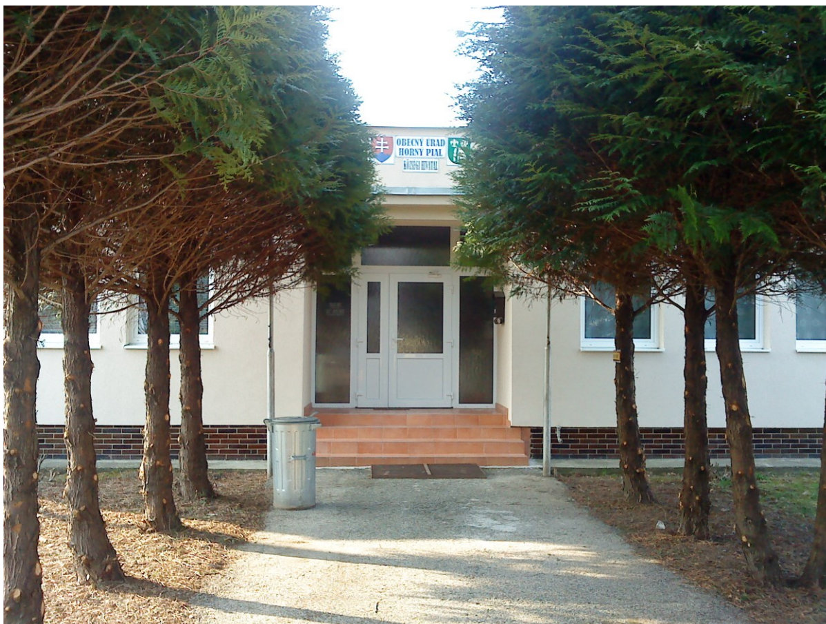
Rekonštruovaná budova Obecného úradu