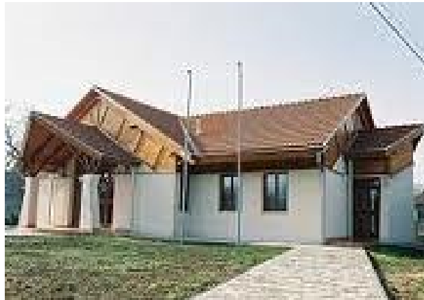
Kultúrny dom v Hornom Piali

hodová zábava, štefanská zábava a silvestrovská zábava. Obecný úrad prispel na tieto akcie finančne sumou 250,- €. V budúcnosti možno očakávať, že spoločenský život sa v obci viac oživí aj organizovaním kultúrnych akcií, organizovaním programov pre deti a mládež a tak isto aj pre dôchodcov.