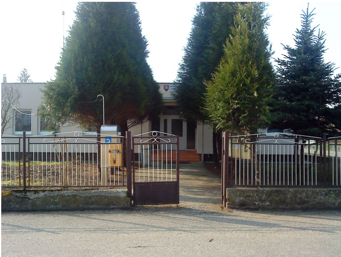
Budova Obecného úradu