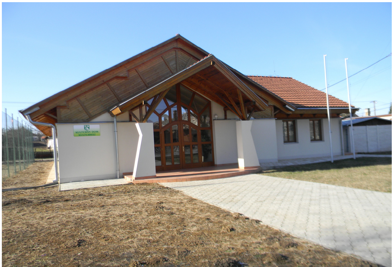
Kultúrny dom v Hornom Piale