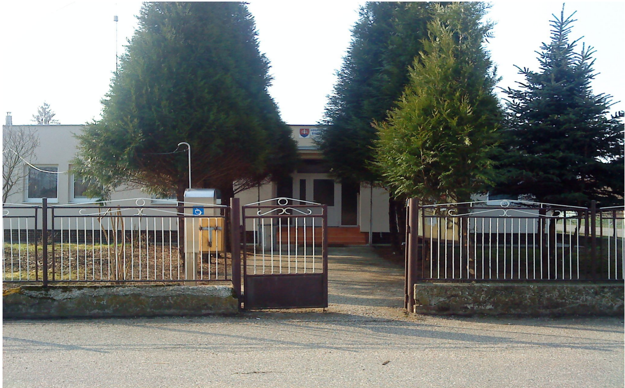
Budova Obecného úradu