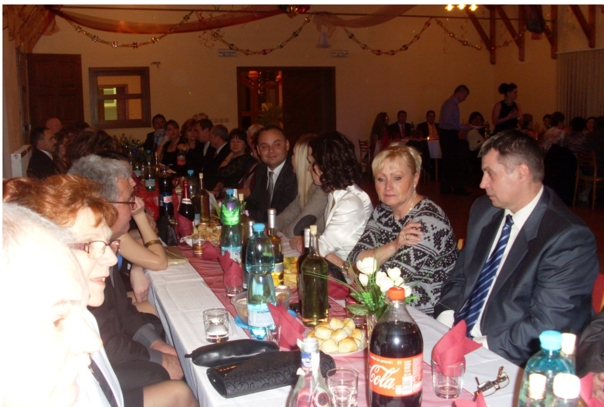
Ples starostu obce