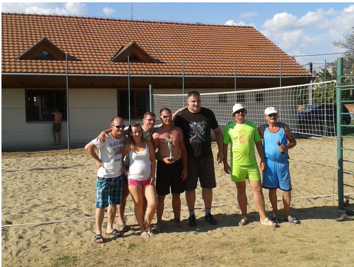
Turnaj v plážovom volejbale

Fanúšikov futbalu potešil na hodovú sobotu 6.9.2014 futbalový zápas starých pánov domáceho mužstva a hostí z Veľkého Ďuru. Väčšiu zručnosť a lepšiu kondíciu prejavili hostia, ktorí právom zvíťazili.