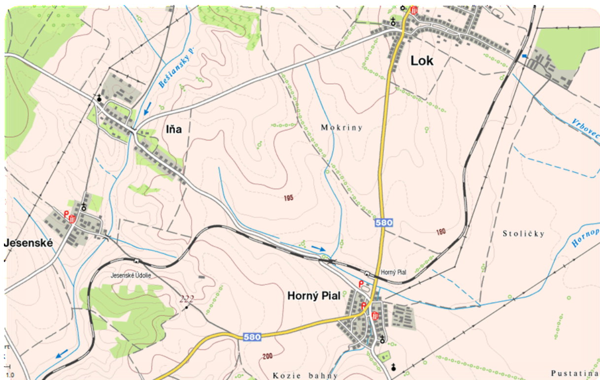
Lokalizácia obce v rámci okresu