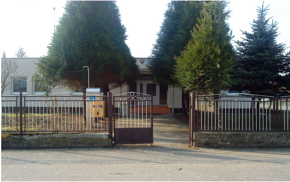
Budova Obecného úradu