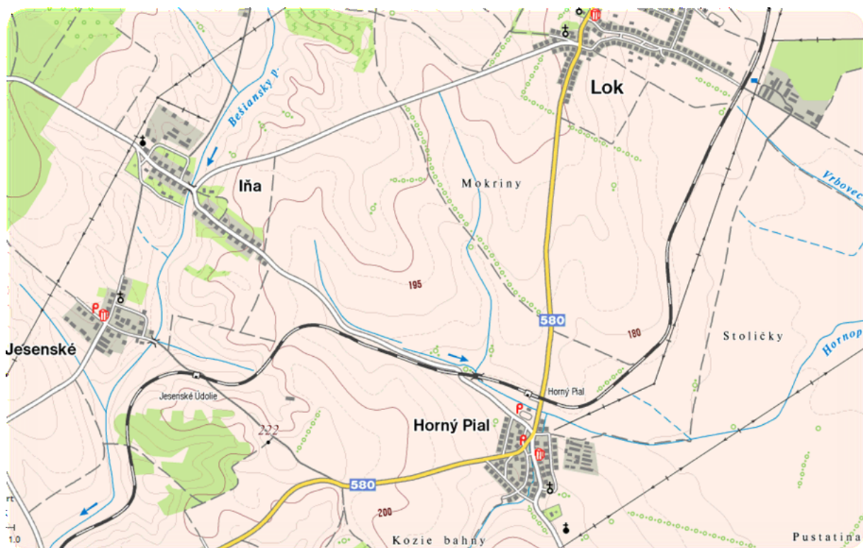
Lokalizácia obce v rámci okresu