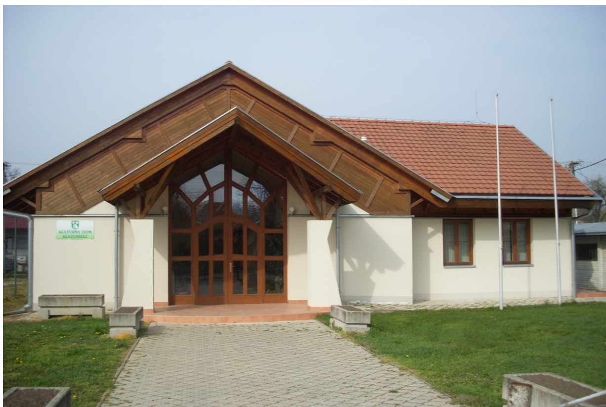
Kultúrny dom v Hornom Piale