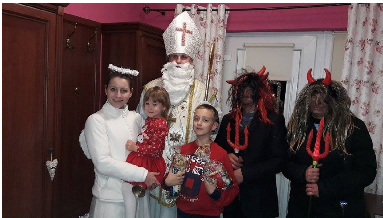
Mikuláš v obci