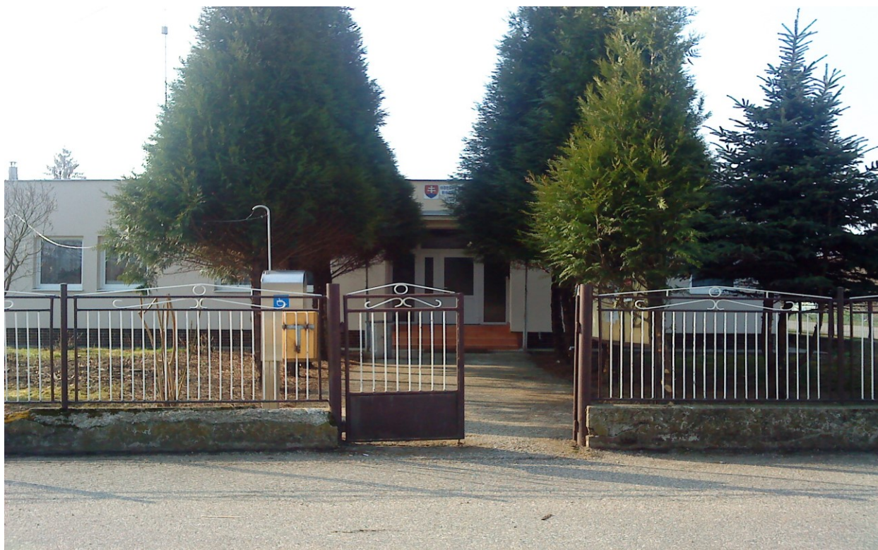
Budova Obecného úradu