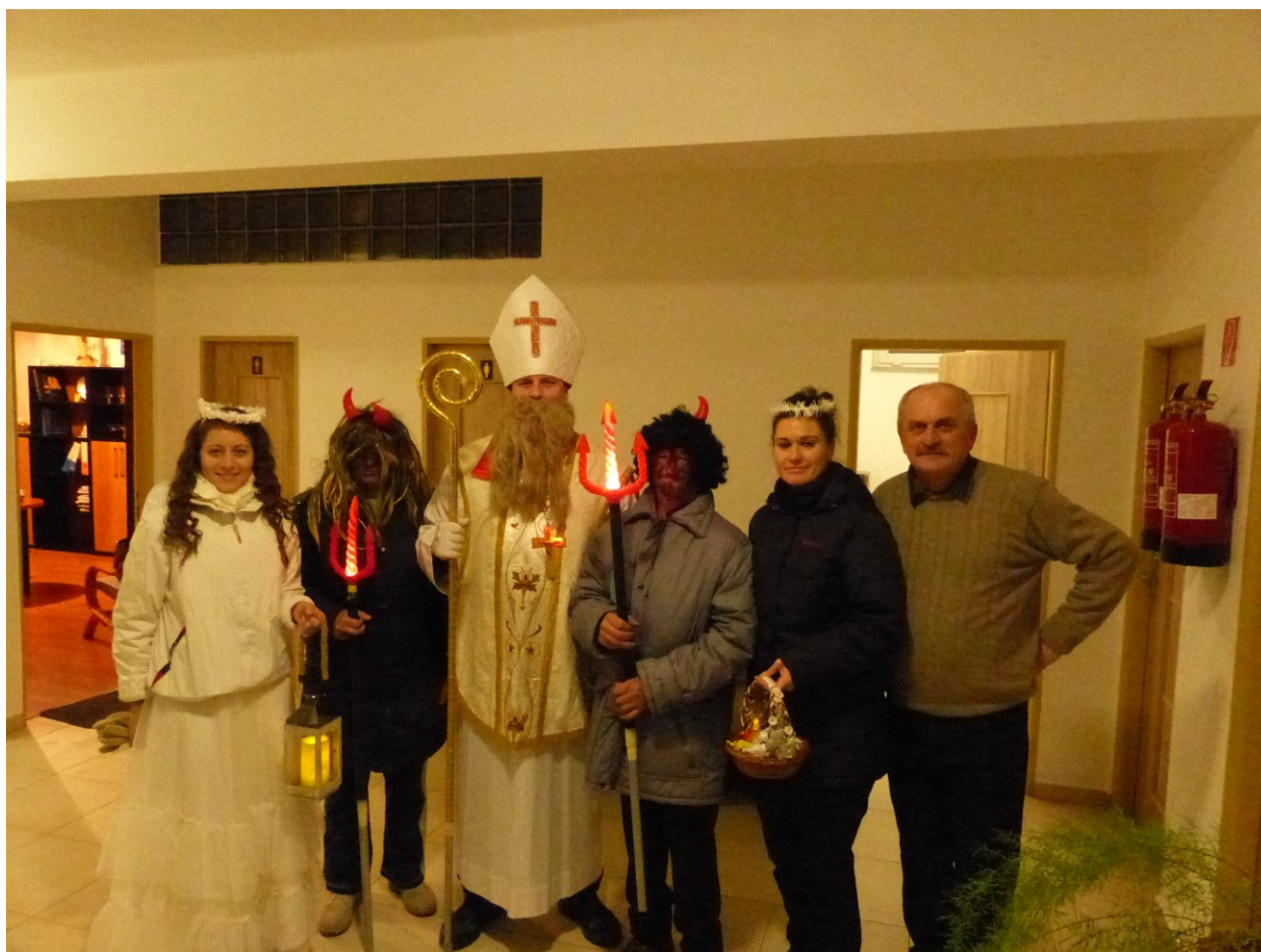
Mikuláš so sprievodom